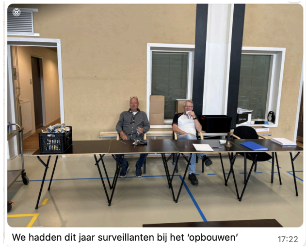
We hadden dit jaar surveillanten bij het 'opbouwen'