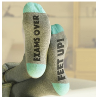
voor onze examenleerlingen

Ik denk dat ik deze sokken aan ga doen. En mezelf ergens verstoppen of zo. Onder mijn bureau ..... In bed ... Zin in ☺.